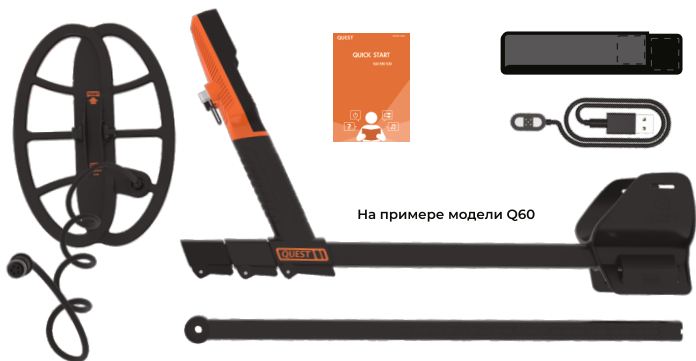
На примере модели Q60