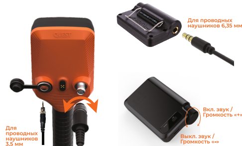
Для проводных наушников 3,5 мм